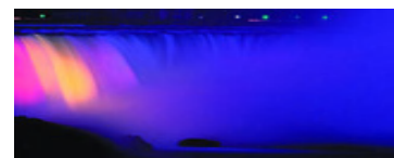
Niagara Falls iluminada