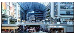
Shopping Mall Eaton Center